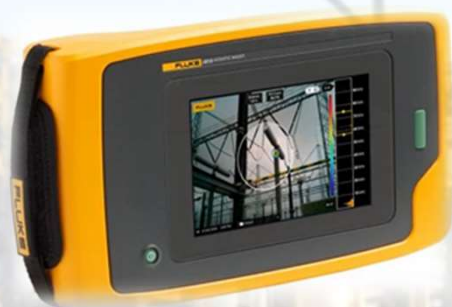
フルーク製 ii910 商品CD:3291214 1ヶ月基本料金:412,000円