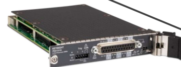
PZ2130/31A 5チャンネル SMU (5チャンネル/1スロット)