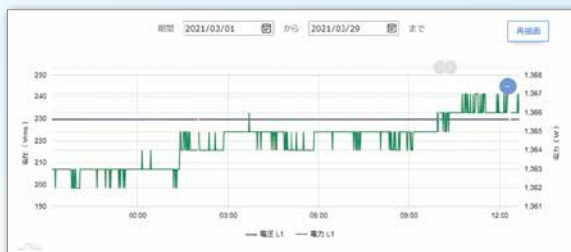
電圧 / 電力 時間変動グラフ