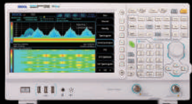
リアルタイム・スペクトラム ・アナライザ 型番：RSA3030E-TG

周波数範囲：9KHz~3.0GHz リアルタイム帯域幅：10MHz リアルタイムモード 表示平均ノイズレベル：-161dBm(代表値) (プリアンプON) EMI測定機能 (オプション適用) パッケージ価格通常：¥725,600 キャンペーン特価：¥588,800