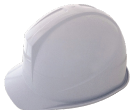
アメリカンタイプ