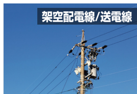
架空配電線/送電線

※SN301は架空配電線用となります。 今後様々な場面に对应したモデルを発売する予定です。