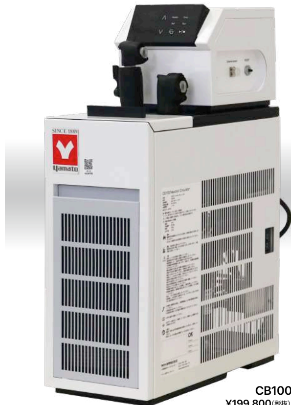
CB100 ¥199,800 (税抜)