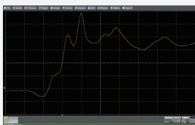
他社製差動プローブでの観測例