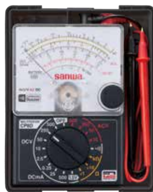
ケース収納時 ケースは標準付属品です