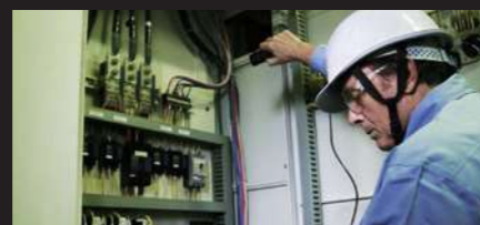
カメラヘッドを取り外せば、楽な姿勢で画面を見ながら、 あらゆる方向の撮影が可能です。