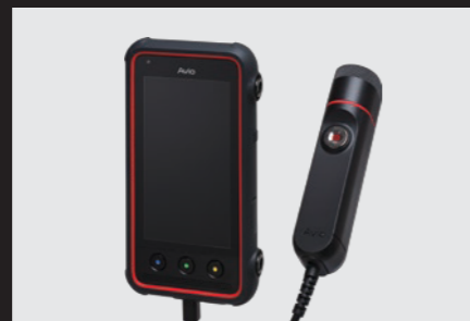
カメラヘッドをコントローラから取り外したセパレーションス タイル。カメラを自由に動かすことが可能です。