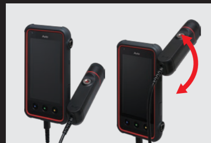
カメラをチルトできるローテーションスタイル。2カ所ある ジョイント部のどちらにでも装着できます。

カメラとコントローラを分離できる新発想のサーモグラフィカメラ「Thermo FLEX F50」。 さまざまな計測スタイルをとれるので、使い方次第で多彩なシーンで活躍させることができます。