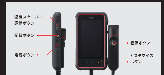
手袋をはめることが多い現場でも、温度スケールの調整や画像記録はボタンでスピーディ に行えます。頻度の高い操作は3つのカスタマイズボタンに割り当てられます