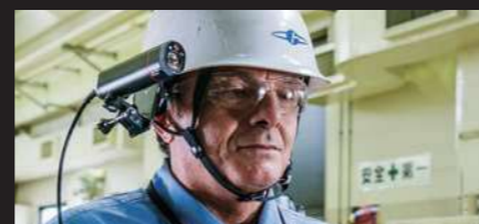
カメラヘッドをヘルメットに装着してウェアラブル感覚で使 用したり、ボールに取り付けて棒カメラ感覚で使用したりでき ます。