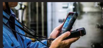
カメラを回転させれば、チルト感覚で撮影可能。高所の撮影 でも首を上向けずに片手で快適に計測することができます。

狭い空間や熱い炉のそば、ボックスの中など、これまで計測が難しかった場所でも効率的な測定を可能にします。