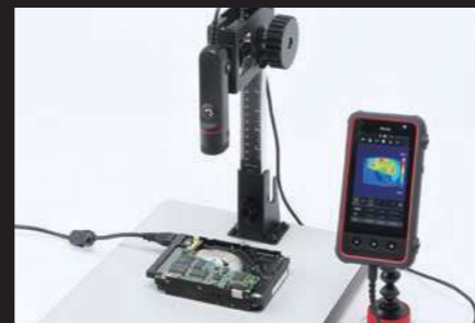
コントローラとカメラヘッドそれぞれに三脚ネジ穴を 設けているので、固定して計測することもカンタンです。