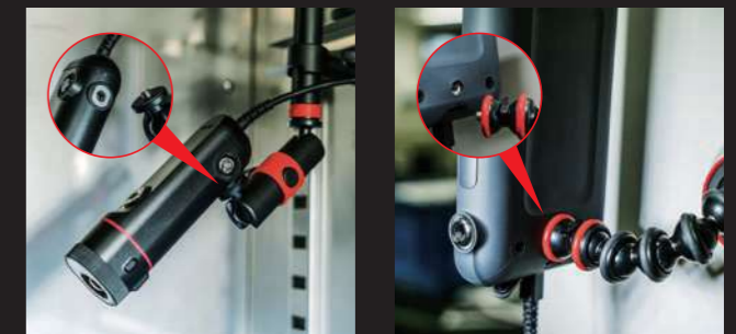
固定して測定しやすいように、三脚ネジ穴や固定ネジ穴を搭載。市販のアクセサリなどと 自由に組み合わせてさまざまな使い方をサポートします。