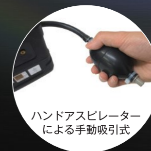
ハンドアスピレーター による手動吸引式