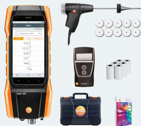
画像は実物と異なる場合があります。